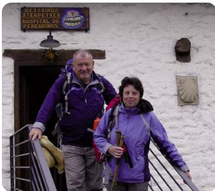
Igartzako erromesen aterpetxeak bisitari asko jaso ditu udan.

La mayoría de los visitantes ha sido de Gipuzkoa: 344. De todos modos, también han recibido la visita de turistas del Estado español, la mayoría de ellos catalanes. Entre los y las visitantes internacionales, la mayoría han sido franceses/as (15) y del Reino Unido (8). También hemos recibido turistas de orígenes tan lejanos como Japón, Malasia o EEUU. «Los y las visitantes han agradecido poder participar en las actividades complementarias. Uno de los talleres más exitosos ha sido el de elaboración de talos».