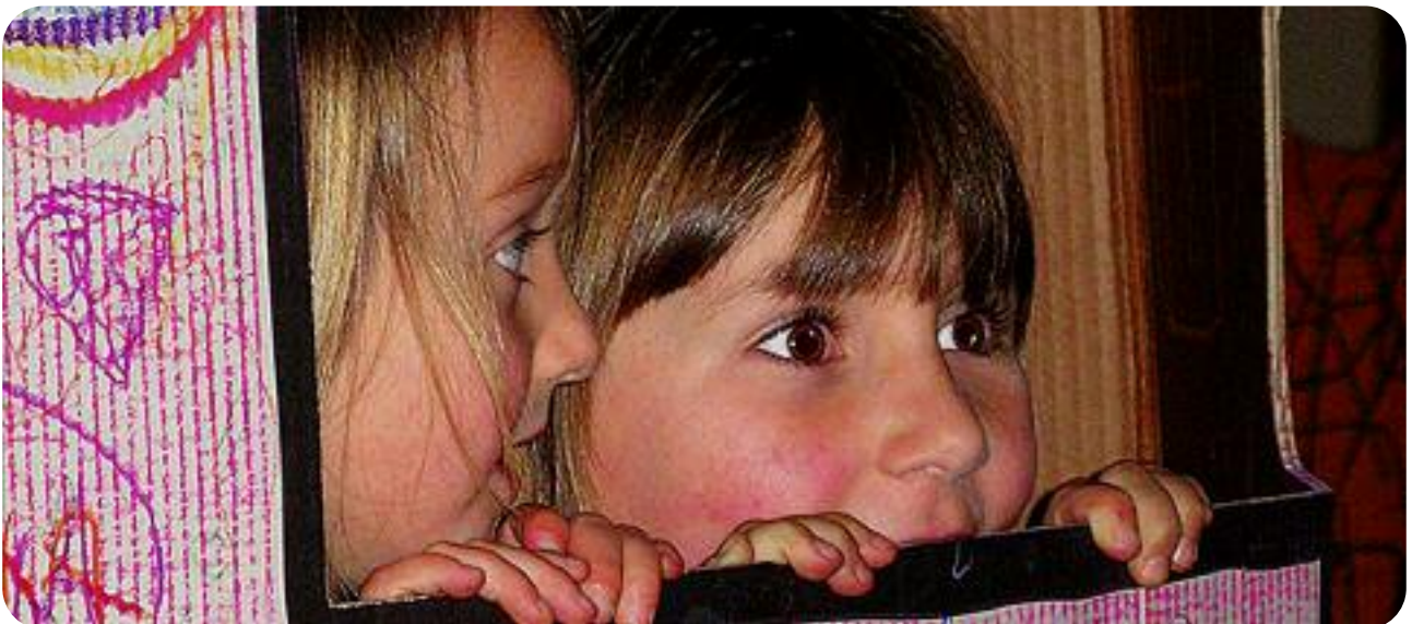
Urriko asteburuetan garatzen da ekimena, eta 6 eta 14 urte bitarteko haurren eta haien familien aisialdira bideratuta dago.

Enmarcado dentro de la agenda Udazken Kulturala, este año destaca el programa Hip-Hip Ürri!, iniciativa enfocada al ocio y consumo cultural para niños y niñas entre 6 y 14 años, y sus familias.