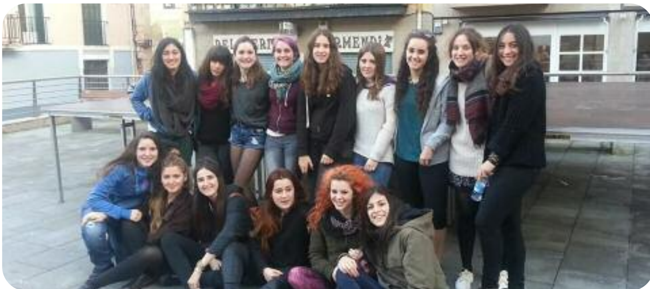
Kontzientzia Moreak taldeko kideak.