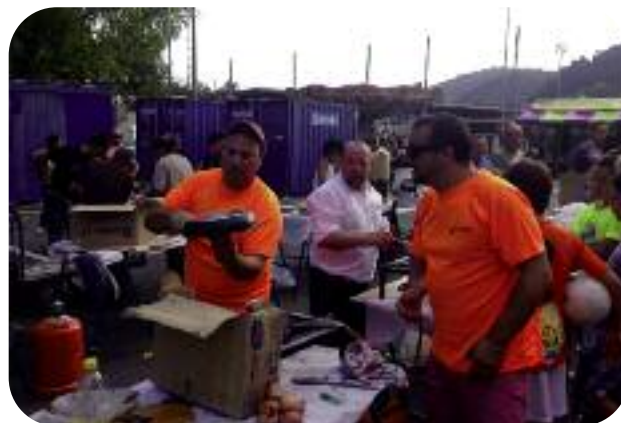
Ezkerrean Beasainmendiko festak, Usurbeko igoera. Eskuinean Igartza-Loinatz auzoko festetan, patata tortila lehiaketa.

eta txokolate jana, larunbateko karaokea, eta igandeko haur jokoak eta antzerkia izaten dira. «Ostiral gauen musika diskoa eta larunbatean kontzertua ere izango dira», gaineratu du.