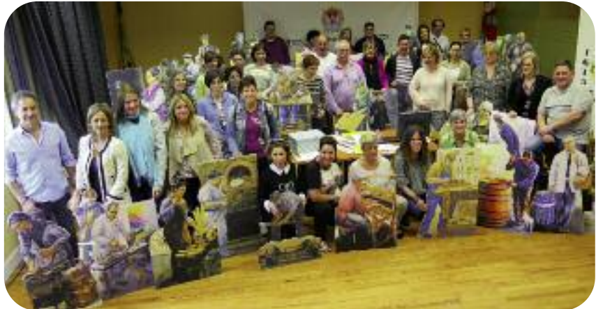
46 dendarik bat egin dute egitasmoarekin.

A raíz de la conmemoración del cuarto centenario de la fundación de Beasain, se han escenificado distintos oficios que an-