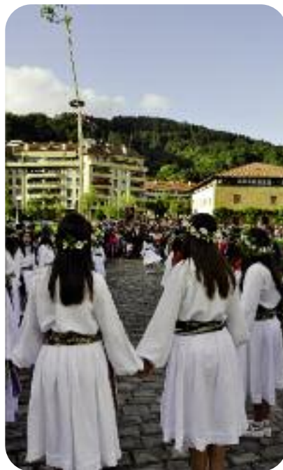
Erraldoiek lagunduta, makala, dantza, kantua eta sua izango dira San Joan bezperako protagonistak.

junto Monumental de Igartza, en 2012 volvieron a levantar el chopo.