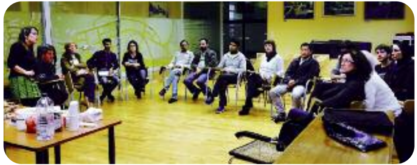
Aniztasuneko bileretan ateratako ondorioak aztertzen ari da Udala.

Bina orduko hiru saio egin zituzten martxoan eta apirilean. Lehenengo saioa gaia kokatzeko eta ulertzeko erabili zuten. Migrazioaren eta aniztasunaren inguruko hausnarketa egin zen. Bigarren saioan elkarbizitzarako akordio-