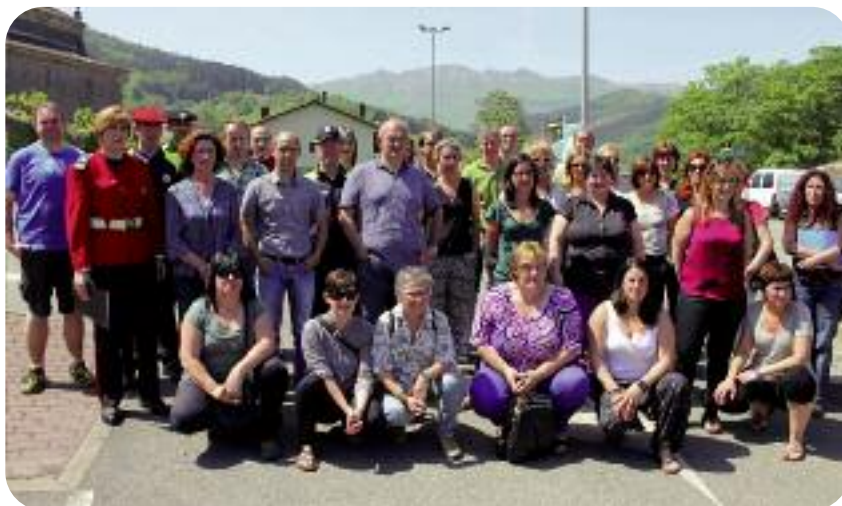
Seguran egin zuten maiatzaren 13an protokoloaren aurkezpena.

Lazkaoko, Beasaingo eta Ordiziako udaltzainek eta Oriako Ertzain etxeak ere bat egin dute protokoloarekin. Hala nola, baita osasun zerbitzuek ere.