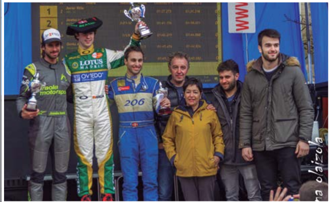
Beasaingo motorraren asteburua