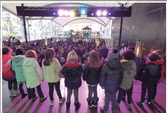
Euskararen Nazioarteko eguna