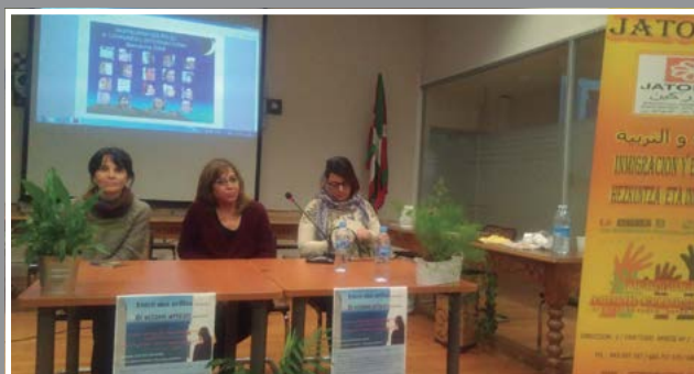
Migranteen eguneko hitzaldia