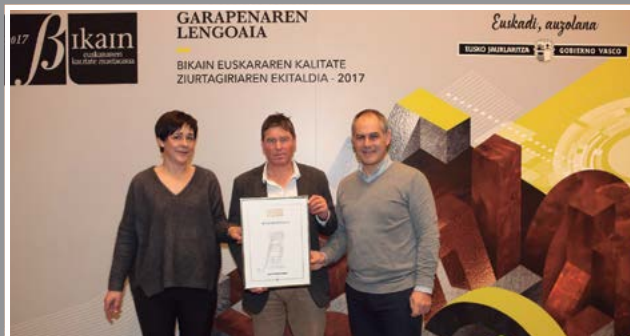
Euskararen bikain ziurtagiria