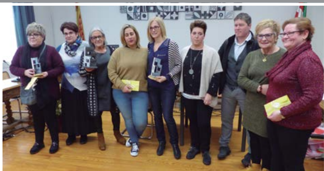
Erakusleho leihaketaren sari-ematea eta omenaldia