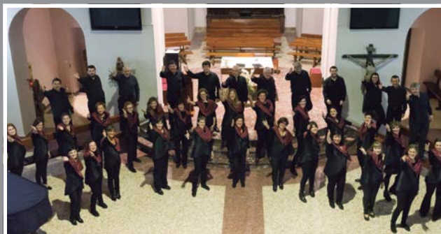
Igartza Musika. Eguberriko kontzertua