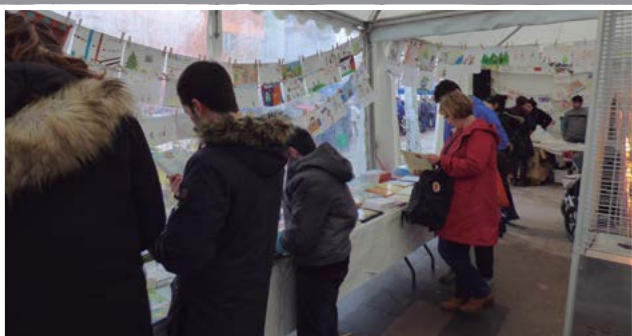
Liburu eta disko azoka