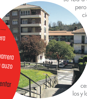
El próximo 13 de mayo, a las 19:00, en el colegio Murumendi los y las vecinas de