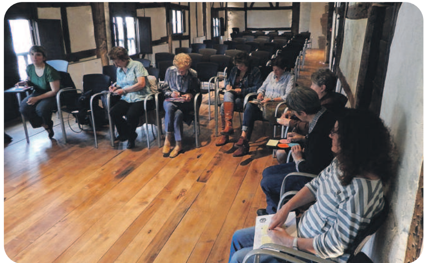
Herritarrekin Igartzan egindako bilera. BEASAINO UDALA

Dagoeneko amaituta dira, beraz, diagnostikoa osatzeko lanak eta informa-