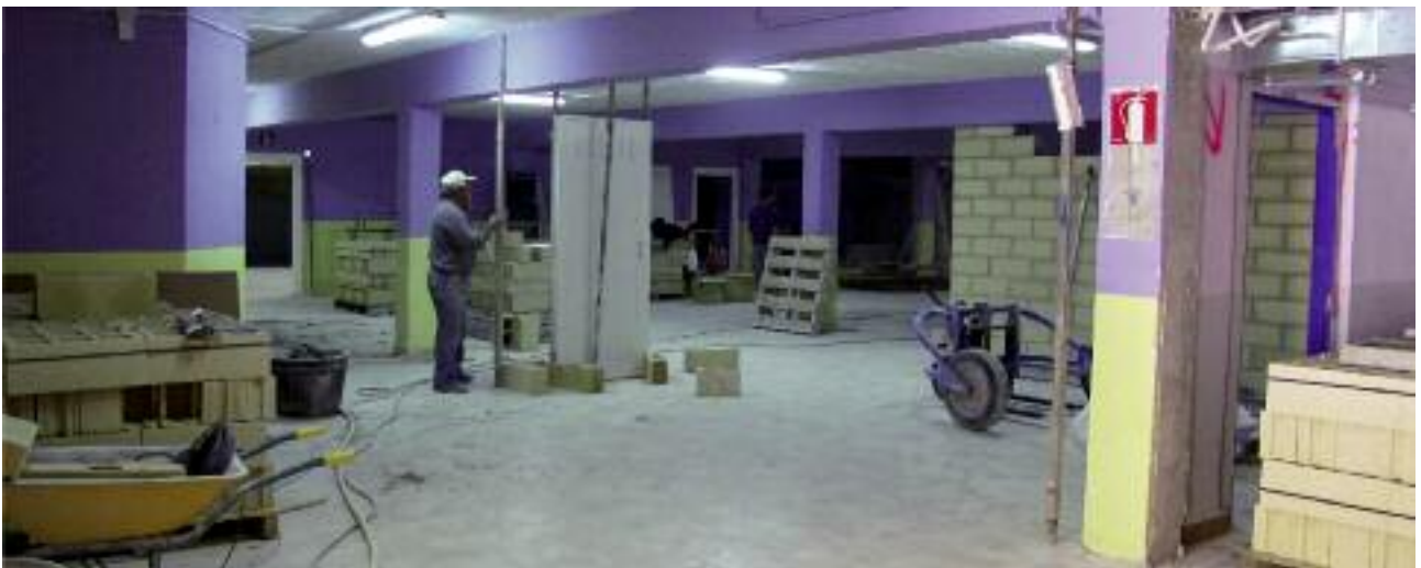
Kiroldegian hasita daude gazteentzako lokalak berritzeko lanak.

Behin berrikuntza lanak egindakoan, lokal horietakoren bat erabili nahi duten taldeek, sorkuntza proiektu bat aurkeztu beharko dute udaletxean, beraien proiektu edo egitasmoen berri emanez.