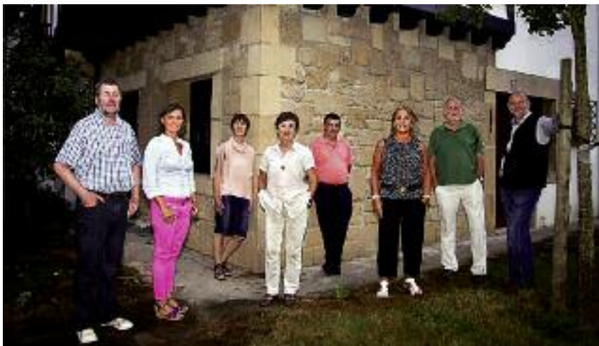
Oskarbi talde beteranoak joko du Beasainen, azaroaren 3an. Elkar