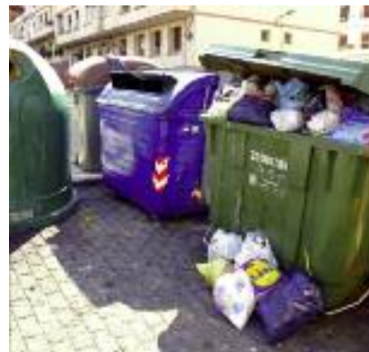
Zabor ontzi bat, Beasaingo erdigunean.

años 90 se han dado grandes pasos. Hasta finales de los 80, se dejaban las bolsas de basura en la calle. Después vino el primer contenedor; en 1991 empezamos a reciclar el vidrio, y dos años después el papel. En 1994 fuimos pioneros en reciclar los envases. El último avance en ese sentido, ha sido el contenedor marrón para separar los residuos