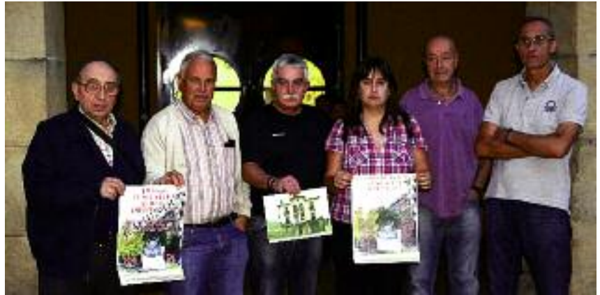
Fusilatuen omenaldia antolatzen ari diren herri ekimeneko kideak.

Herri ekimenekoan arabera, gau hartan 36 lagun fusilatu zituzten, baina badira beste 17 ere, ondorengo hilabete eta urteetan fusilatuta hil zituztenak. Horien guztien izenak bildu dituzte, baita gehienak fusilatu zituzten eguna eta lekua ere. Omenaldi hori eta oroigarri hori «ekimen herrikoia» izatea nahi dute, eta horretarako, bono laguntza batzuk atera dituzte. Herriko tabernetan daude salgai, 5 eta 10 euroan. Kontu korrante bana ere zabaldu dute, Kutxa-banken eta Euskadiko Kutxan.