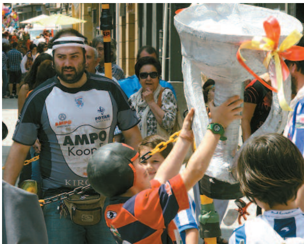
Mota eta kolore guztietako mozorroak atera zituzten kalera.