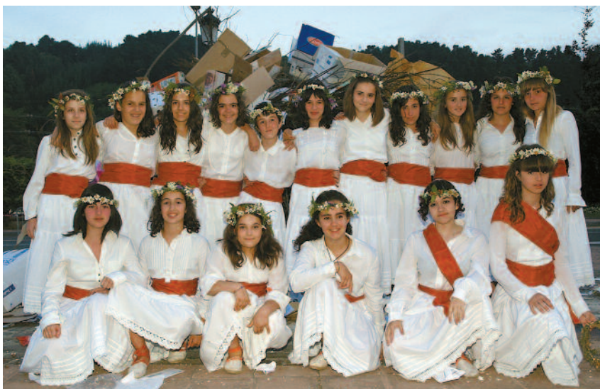
San Joan bezperan neskatxen soka-dantza egingo dute.