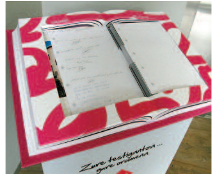
Euskaltegiako Memoriaren liburua.

Bestalde, udarako ikastaroak antolatu dituztela ere jakinarazi dute. «Egunean lau orduko ikastaroa izango da; ekainaren 25etik uztailaren 20ra izango da bat, eta bestea irailean». Izena emateko epea, hil honen 15ean bukatuko da.