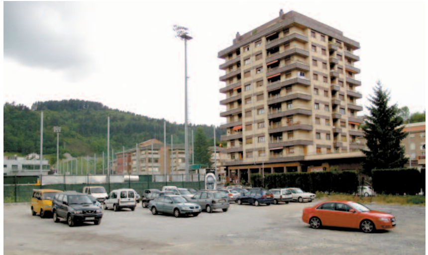
Igartza-Oletan 116 autorentzako aparkalekua egokituko dute.

H errigunetik gertu, Igartza-Oleta kalean, Beasainek beste aparkaleku handi bat edukiko du. Orain ere aparkaleku bezala erabiltzen den gunea txukunduko du udalak. «Momentuz, bertan egiteko proiekturik ez dagoenez, dagoen eremua txukundu eta aprobetxatzea erabaki da», dio udalak. Guztira, 116 ibilgailurentzako lekua egokituko da. Kalera irekiko da aparkalekua, orain dauden zuhaixkak bota egingo baitira. Hasiera batean todo uno botatzea aurreikusten bazen ere (aurrekontuan 20.000 euroko partida zegoen) urak hartu, argiteria jarri eta asfaltatu egingo da (80.000-90.000 euroko aurrekontua du obrak).