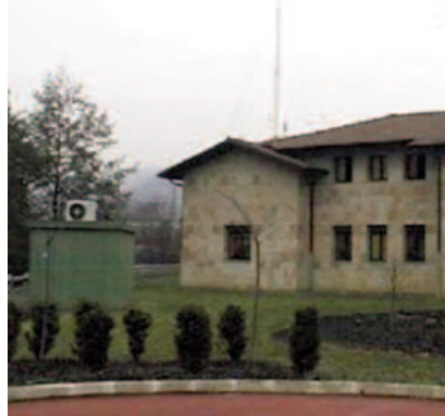
Gipuzkoa plazako neurgailua.

A irearen kalitatea kontrolatzeko eta zaintzeko 67 estazioz osatutako sarea du Eusko Jaurlaritzak. Sare hori, sensore modernoekin hornituta dago, eta Europako zuzendaritzak zehazten dituen kutsatzaileak neurtzen ditu, batez ere SO 2 , oxido nitrogenoa, ozono troposferikoa, CO eta suspentsio partikulak. Era berean, estazio horrek, haizearen norabidea eta abiadura, tenperatura, hezetasun erlatiboa, presioa, erradiazioa eta prezipitazioa bezalako parametro meteorologikoak