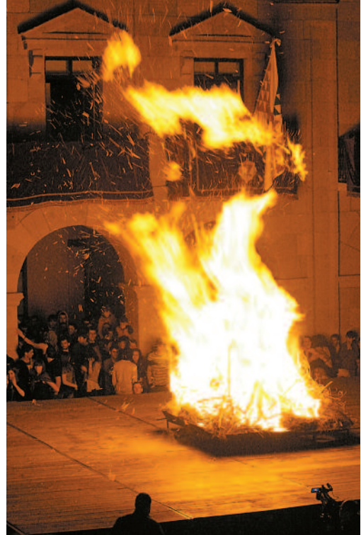
Sua plazan, Mariaren jaitsieran.