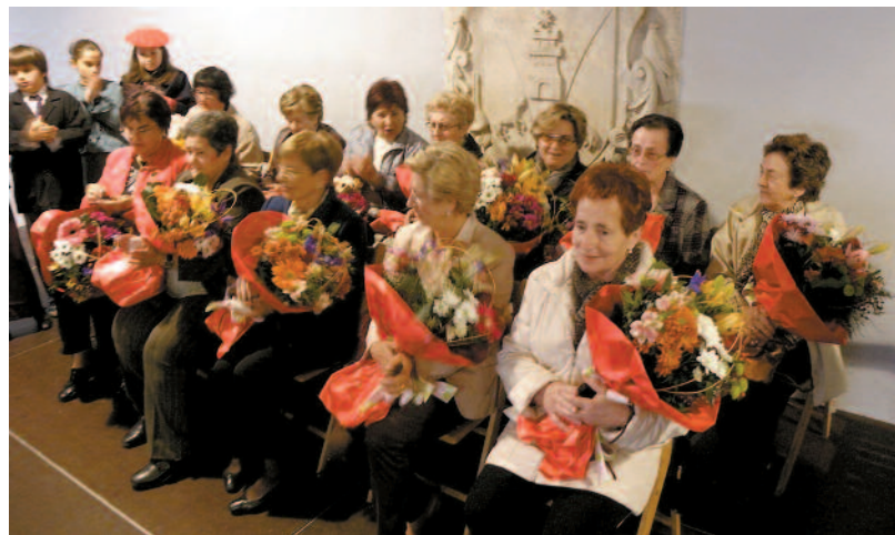
Duela 50 urteko danborradan parte hartu zuten emakumeei omenaldia.