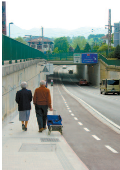
Senperera doan bidegorri zatia.

D atozen sei hilabeteetarako badu beste erronka bat Beasaingo Udalak; Bizikleta Plana osatzea. Horrekin, bidegorri sarea osatu eta erabilera arautu nahi ditu. Bizikleta erabiltzaileekin batera egingo dute prozesua, eta herrigunean, bidegorria nondik nora egingo den zehaztu nahi da. «Orain arte bidegorria zatika joan dira egiten baina ez dago plan edo proiektu oso bat», dio udalak. «Proiektua eginez gero, obrak egiten ari diren heinean joango gara gauzatzen. Agintaldi honetan herri barruko bidegorria bukatzea dugu helburua», gaineratu dute. Plan horren barruan, bizikletak gordetzeko aparkaleku itxiak egitea eta bizikletaren erabilera bultzatzeko kanpaina txertatzea ere aurreikusten du udalak.