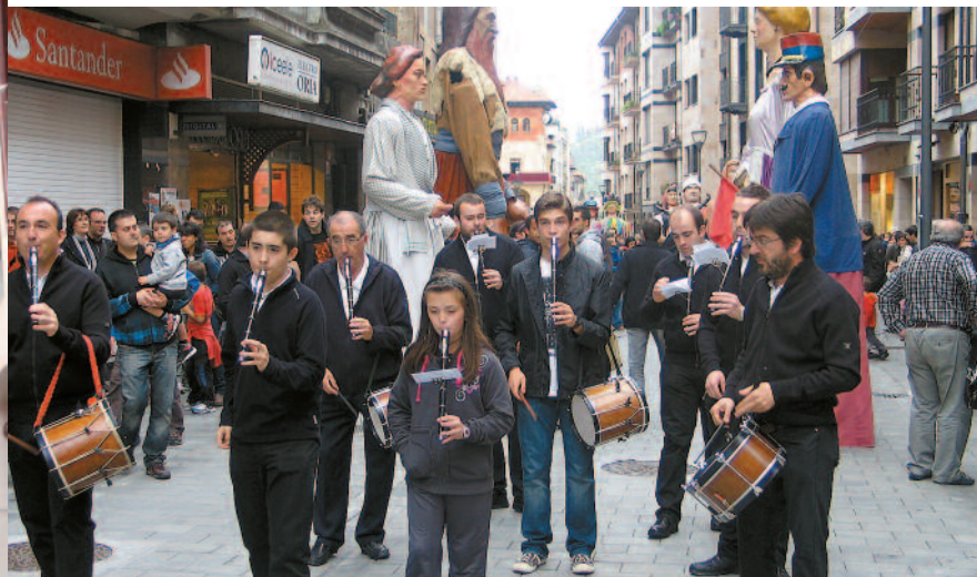
Herriko txistulari taldea kalejiran, atzean erraldoiak dituztela.