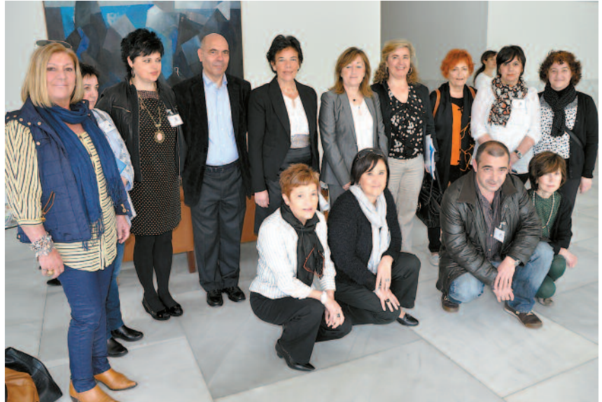
Amara Berri proiektuan sartuta dauden ikastetxeetako ordezkariak, sailburuarekin.

Bilboko jardunaldietan, beraien esperientziaren berri eman dute Murumendi-