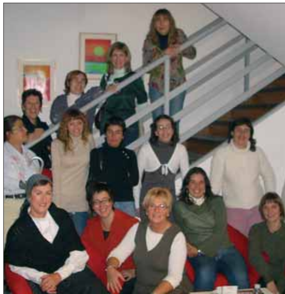
Beasaingo Euskaltegiko zenbait ikasle "Goenkale" telesailaren grabaketan izan dira.

Matricula abierta hasta 15 de enero. Maila guztiak.