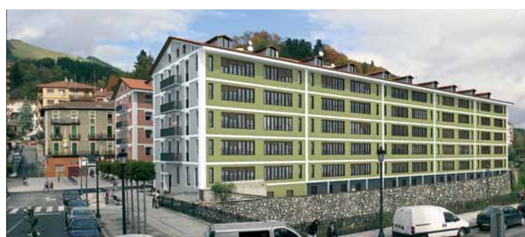
Birgaitze Planaren fotomontajea.